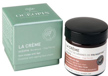
Crème visage Océopin