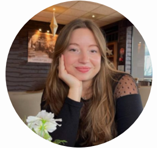
Julie Beunier @juliebnr