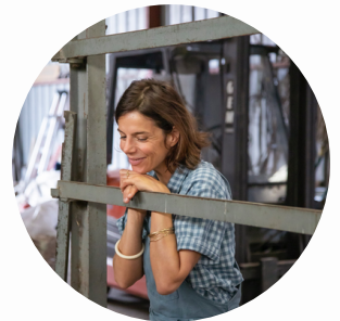
Marina Berger @Océopin.com