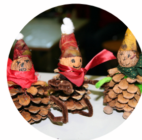
Bricolages proposés les années précédentes