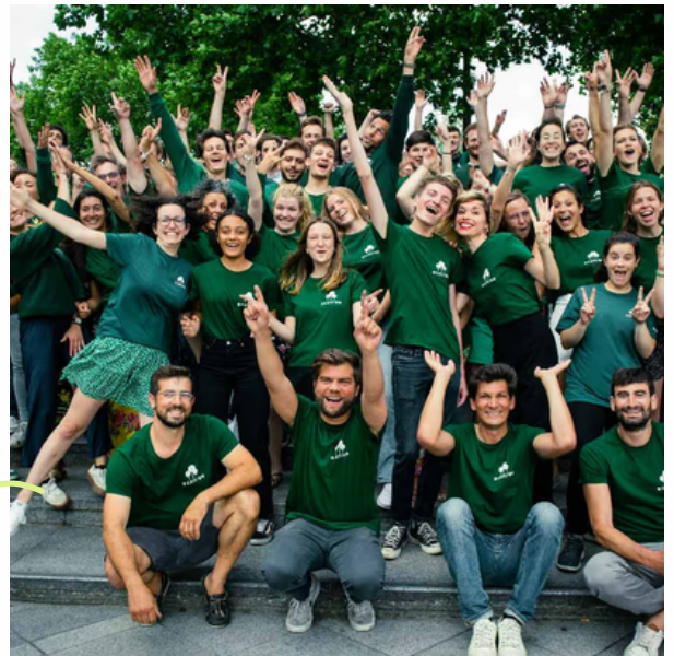
équipe Ecotree @Ecotree.green

« Une forêt gérée durablement offre de nombreux services sociaux, économiques et écologiques. Chaque jour, des femmes et des hommes y œuvrent pour pouvoir récolter de beaux arbres. À sa hauteur, chacun peut contribuer à l'expansion des forêts ! » , rappelle la société de gestion forestière.